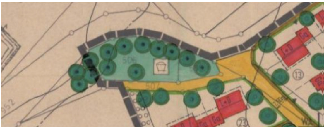
Ausschnitt Planbereich bisheriger Bebauungsplan, Stand 27.12.1982

Die betroffenen Flächen sind bislang als öffentliche Grünflächen mit Zweckbestimmung Spielplatz und Verkehrsflächen wie im nachfolgenden Planausschnitt dargestellt festgesetzt.